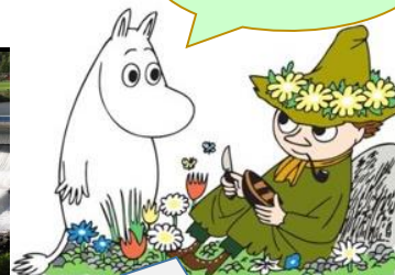
ノルウェーのキャラクターではありません

ノルウェー：ヨーロッパの北極側に位置し、冬は雪と氷に閉ざされた谷、「フィヨルド」が有名。水源が豊富で水力発電が国の95%を賄う。また、北海油田で国内エネルギーの6~7倍の石油や天然ガスを採掘し輸出